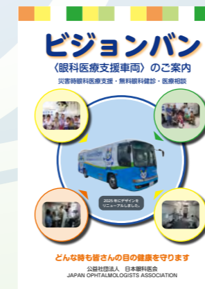
ビジョンバン小冊子