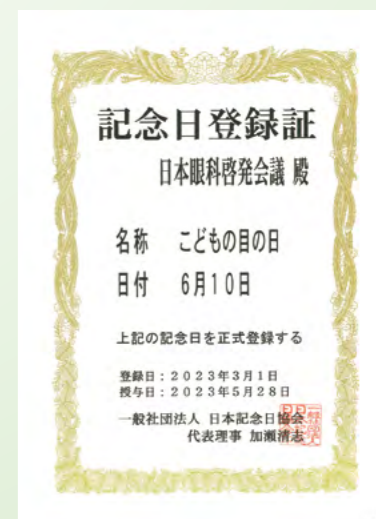
こどもの目の日登録